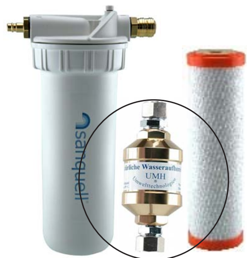
Artikel-Nr. 775 UMH Paket UT Quick bestehend aus: Filter Solo UT Quick, mit kompl. Anschlussmaterial Filtereinsatz SPFP Superpure, UMH - Kleingerät