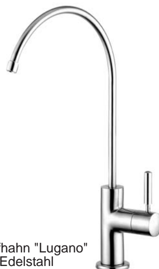
Option: Auslaufhahn "Lugano" kompl. Edelstahl