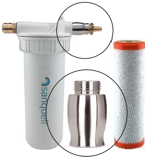
Artikel-Nr. 792 Sanquell-Paket UT bestehend aus: Filter Solo UT-Quick mit komplettem Anschlussmaterial, Filtereinsatz SPFP Superpure, Sanquell Veredler "UT-Filter",