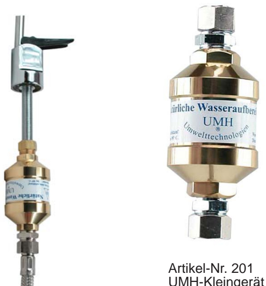
Artikel-Nr. 201 UMH-Kleingerät

z. B. die hochwirksame UMH-Kleingerät montieren Sie am Zulauf des separaten Auslaufhahns oder am Filter direkt.