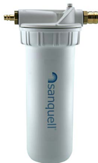
Artikel-Nr. 130 ohne Filtereinsatz

SFP Standard (NFP Premium) SPFP Superpure (IFP Puro) CBR 2 Comfort (nur Sanquell)