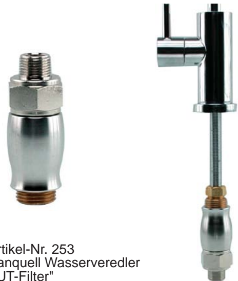
Artikel-Nr. 253 Sanquell Wasserveredler "UT-Filter"

z. B. des Sanquell Veredlers "UT-Filter" durch bequeme Montage am Edelstahl Auslaufhahn "Lugano" möglich.