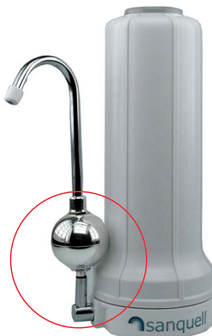
Artikel-Nr. 771 UMH Paket AT Edelstahl bestehend aus: Filter Solo AT, Filtereinsatz SPFP Superpure, UMH Energetisierung "Kugel" mit verkürztem Auslaufbogen