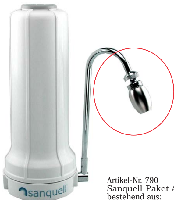
Artikel-Nr. 790 Sanquell-Paket AT bestehend aus: Filter Solo AT, Filtereinsatz SPFP Superpure, Sanquell Veredler "Filter", Edelstahl-Auslaufbogen m. Gewinde