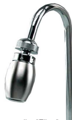
Artikel-Nr. 252 Sanquell Wasserveredler "Filter"

z. B. des Sanquell Wasserveredlers "Filter" durch bequeme Montage am Edelstahl Auslaufhahns möglich. Lösen sie einfach den Strahlregler und schrauben Sie den Veredler auf das vorhandene Gewinde.