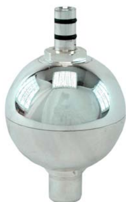
Artikel-Nr. 202 UMH-Kugel

z. B. die hochwirksame UMH-Kugel. Bei Bestellung eines Paketes, erhalten Sie die Kugel komplett montiert. Sollten Sie eine Nachrüstung vornehmen wollen, liefern wir Ihnen den verkürzten Auslaufbogen und die verlängerte Auslaufpfeife zur Montage mit.